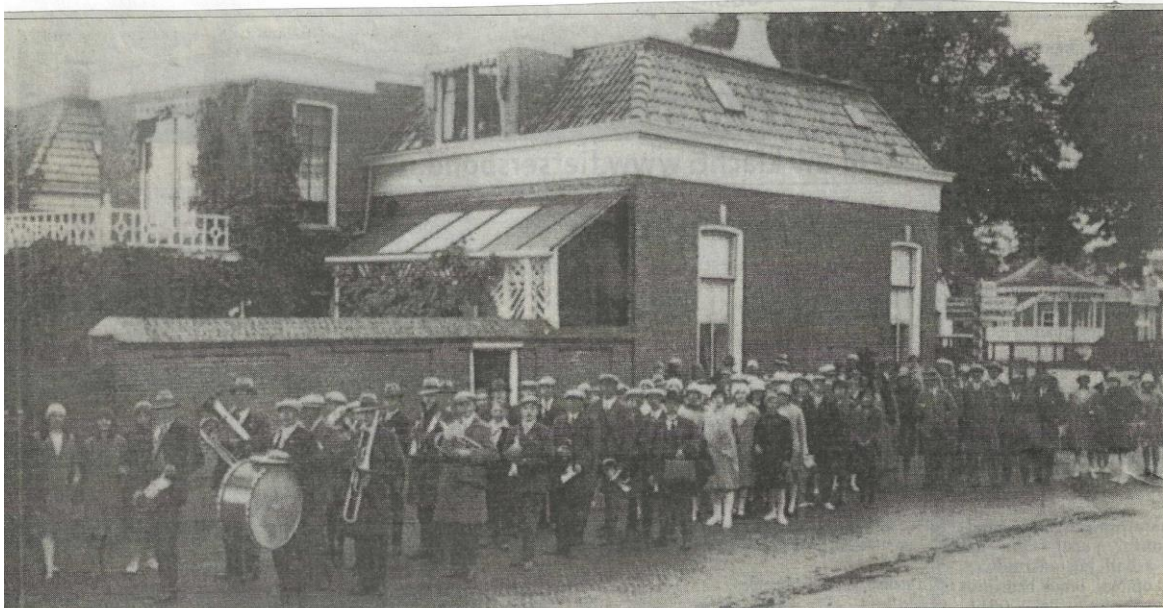
Optocht van de muziekvereniging 'Concordia' omstreeks 1934. Op de achtergrond het huis op de Bakkershoek waar diverse leden van het geslacht Kuipers woonden.